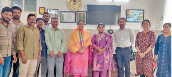
గజ్వల్ ప్రభుత్వసమితి దాక్షర్ అన్నపూర్ణను సన్మానిస్తున్న దృశ్యం