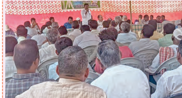
అవగాహన సదస్సు నిర్వహిస్తున్న దృశ్యం